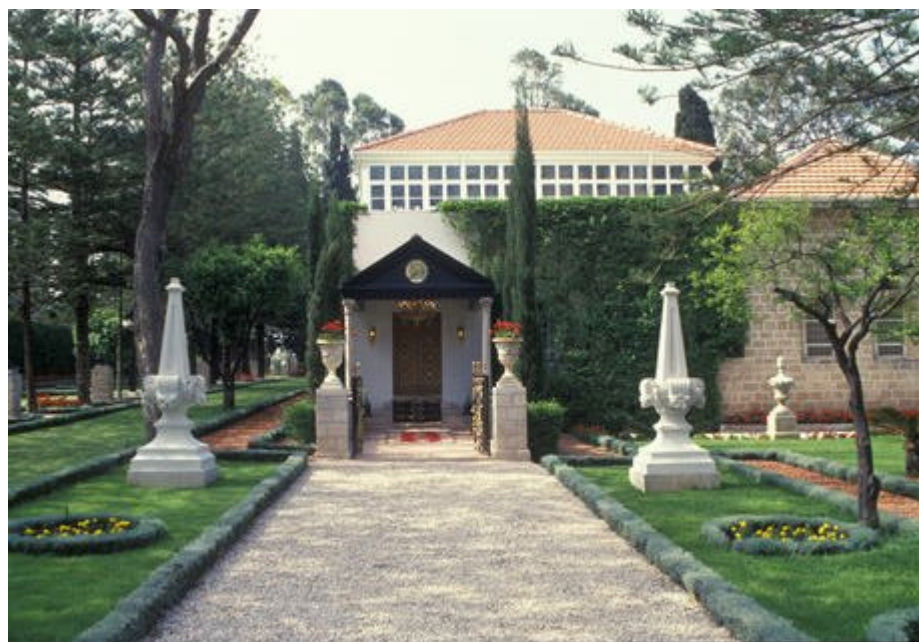
Entrada al Santuario de Bahá'u'lláh, Bahjí

Así Bahá'u'lláh llegó a la Tierra Santa y a la viña de Carmelo como prisionero por orden de dos reyes. Él llegó allí ochenta años antes del establecimiento del Estado de Israel y cuando esta tierra era una provincia yerma y de poca importancia del imperio Turco. Durante los 40 años de Su misión, Bahá'u'lláh aceptó con aquiescencia y conformidad Sus sufrimientos, exilios, privaciones y condenas. Proclamó que al aceptar estas adversidades Su propósito era la redención de la humanidad.