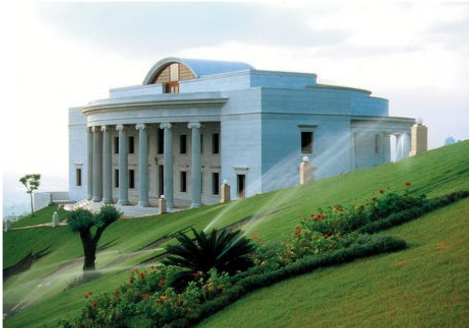
El Centro Internacional de Enseñanza