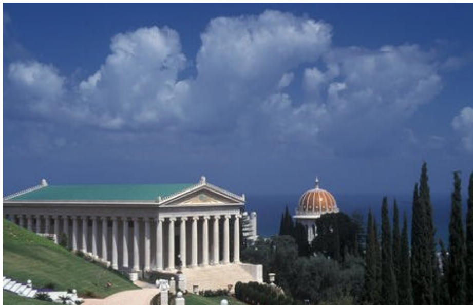
El Edificio de los Archivos Internacionales