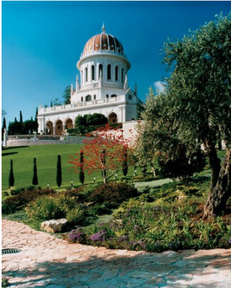
El Santuario de El Báb