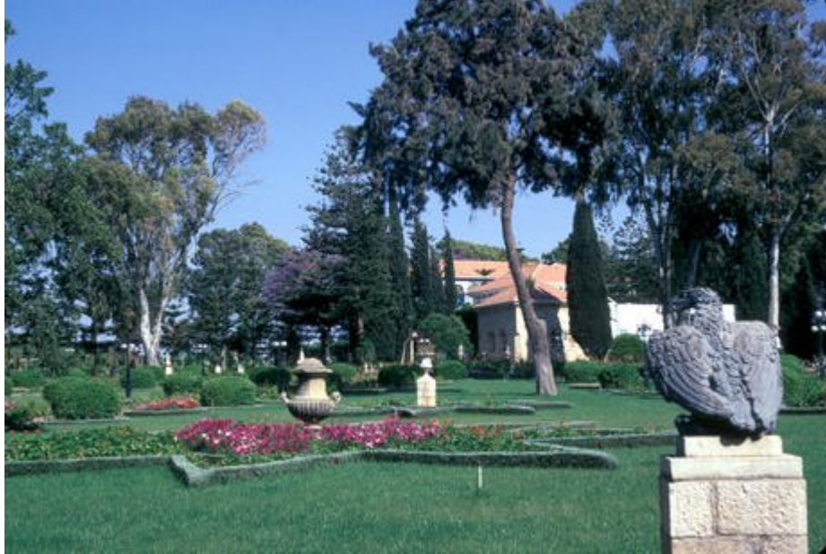
El Santuario de Bahá'u'lláh en el valle de Sarón

“Estalle en flor y se regocije hasta lanzar gritos de júbilo cantando: ‘La gloria de Líbano le ha sido dada, el esplendor del Carmelo y de Sarón, ellos verán la Gloria del Señor, y el Esplendor de nuestro Dios’. (Isaías 35:2)