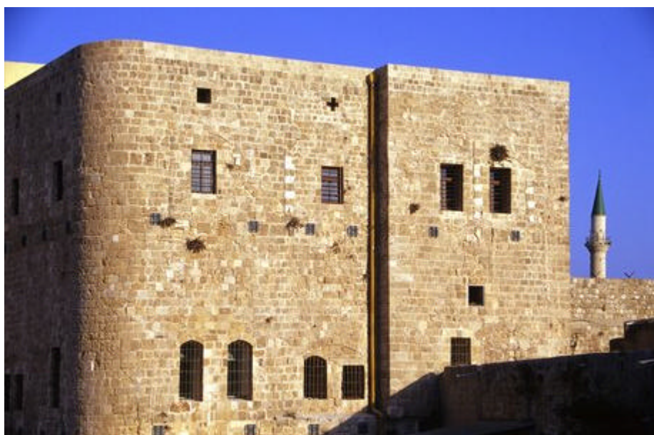
Ciudadela de 'Akká donde Bahá'u'lláh fue encarcelado por dos años

“La Antigua Belleza ha consentido ser sujeto con condena para que la humanidad pueda ser liberada de su cautiverio, y ha aceptado ser prisionero dentro de esta poderosa fortaleza, para que todo el mundo pueda alcanzar la verdadera libertad. Ha bebido hasta los posos de la copa del dolor, para que todos los pueblos de la tierra logren felicidad perdurable y sean colmados de dicha. Esto es por la misericordia de Dios, el Compasivo, el Más Misericordioso. Hemos aceptado ser humillados, oh creyentes en la Unidad de Dios, para que vosotros podáis ser enaltecidos, y hemos sufrido múltiples aflicciones, para que podáis prosperar y florecer. ¡Observad cómo aquellos que se han imaginado ser socios de Dios, han obligado a Aquél Quien ha venido a reconstruir el mundo entero, a vivir en la más desolada de las ciudades.” (58)