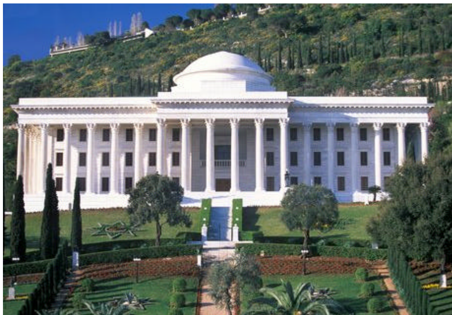
La Casa Universal de Justicia