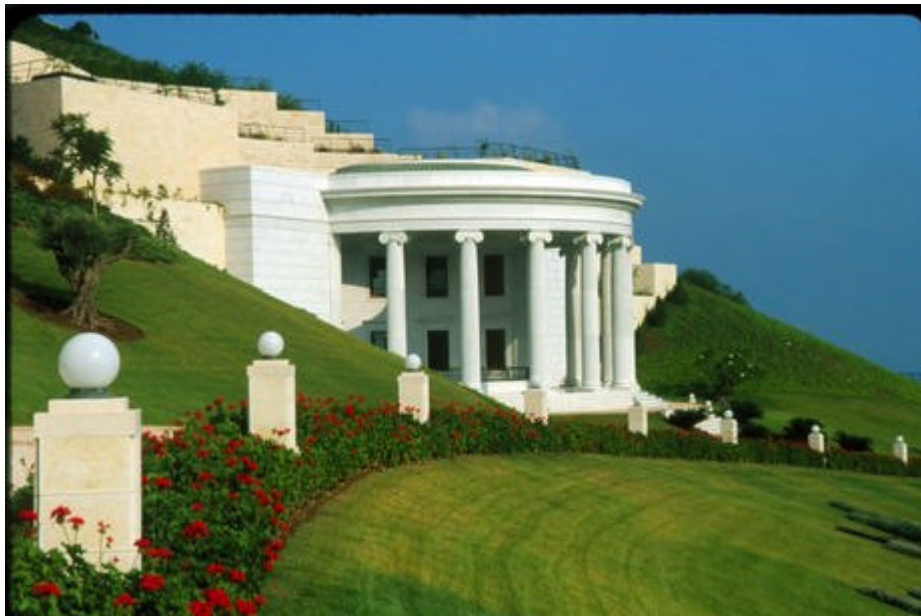
El Centro de Estudio de los Textos