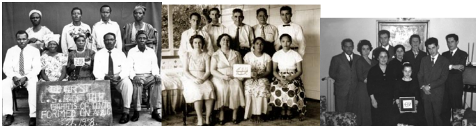
AEL de de Tinto 58' AEL de Samoa, 57' AEL de Palermo, 58'

Toda comunidad local bahá'í elige su propio Cuerpo consultivo, una Institución creada por Bahá'u'lláh y llamada Casa de Justicia. Por el momento, estos cuerpos, de los que hay varios miles en el mundo, son llamados Asambleas Espirituales.