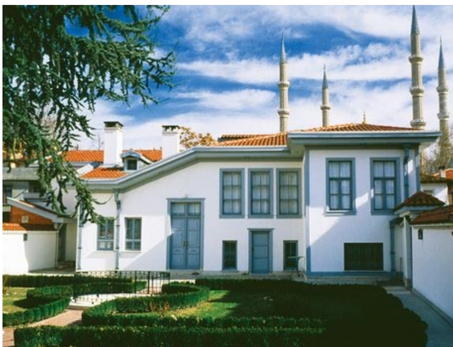
La casa de Bahá'u'lláh donde residía en Adrianópolis,(Edirne, Turquía) un poco antes de Su exilio a 'Akká,

Desde Constantinopla, luego de transcurridos cuatro meses, Bahá'u'lláh fue enviado a Adrianópolis. En dicha ciudad, formuló la declaración pública de Su Misión, proclamando a Su Revelación como la anunciada por El Báb. Allí Él escribió algunas de las famosas “Cartas a los reyes”, manuscritos en los cuales enfatiza los principios de la justicia, y donde es delineado un plan de seguridad colectiva. Allí sufrió aún más como consecuencia del odio de Mírzá Yahyá, quien trató de envenenarlo y luego, de hacerlo asesinar.