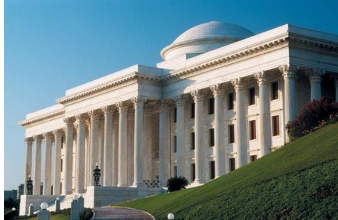
Sede de la Casa Universal de Justicia laderas de Monte Carmelo, Haifa, Israel