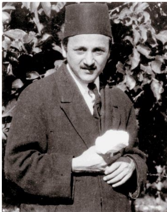
Shoghi Effendi, el Guardián de la Fe Bahá'í Liberó la Fe bahá'í, desde 1921 hasta su muerte en 1957

En lugar de ello, la Fe ha avanzado firmemente bajo la dirección de su Guardián designado, Shoghi Effendi, incorporado en sus filas a gentes de todas las razas, clases y religiones existentes en todas partes del mundo, superando persecuciones y estableciendo su Orden Administrativo sobre un fundamento universal.