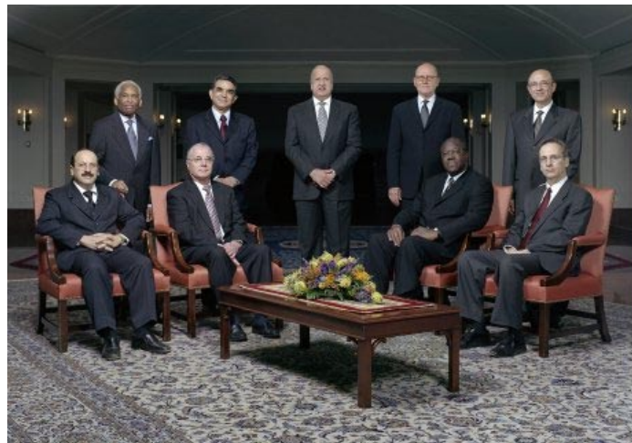
Miembros de la Casa Universal de Justicia, abril, 2005

Cuando 'Abdu'l-Bahá estableció la Guardianía hizo del Guardián la cabeza permanente de la Casa Universal de Justicia y con el principio de la primogenitura, dispuso una sucesión de guardianes, quienes ocuparían esa posición. Sin embargo, Shoghi Effendi falleció sin dejar sucesión, en noviembre de 1957, cinco años y medio antes que la comunidad bahá'í mundial estuviera suficientemente desarrollada, de acuerdo con su plan, para la elección de la Casa Universal de Justicia. Como había sido previsto por él, esta Institución fue elegida en 1963 y ahora perpetúa para el mundo bahá'í Guía divina, la que constituye la cualidad peculiar de la Alianza de Bahá'u'lláh.