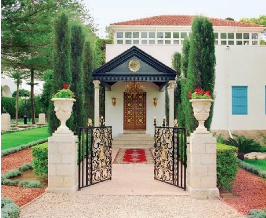
El Santuario de Bahá'u'lláh, en Bahjí, 'Akká, Israel

“El rostro a Aquel a Quien contemplé, nunca lo podré olvidar y, no obstante, no puedo describirlo. Esos ojos penetrantes parecían leer en mi propia alma; en Su amplia fuente había poder y autoridad, mientras que las profundas arrugas de Su ceño y Su faz denotaban una edad que parecía negar el negro azabache de Su cabello y Su barba que descendía exuberante casi hasta la cintura. ¡No necesitaba preguntar en presencia de Quién me encontraba al inclinarme ante Quien es el objeto de una devoción y un amor que los reyes podrían envidiar y por los cuales los emperadores suspiran en vano!”