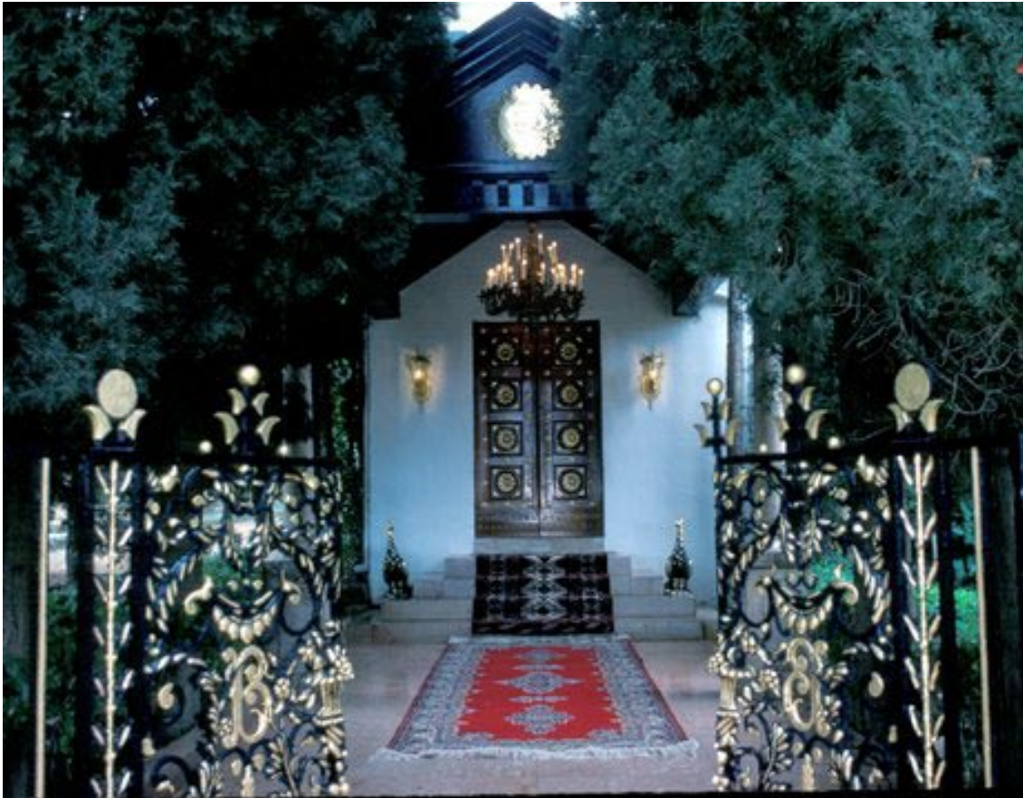
Entrada al Santuario de Bahá'u'lláh ubicado en el valle de Sarón