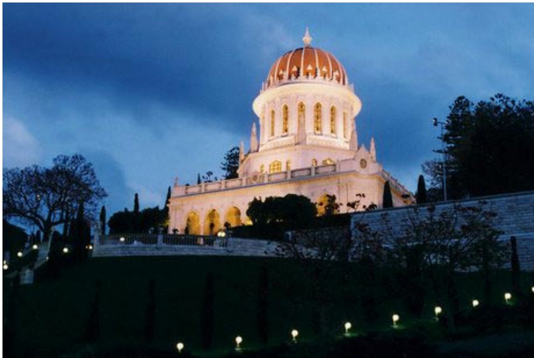
El Santuario de El Báb en la noche