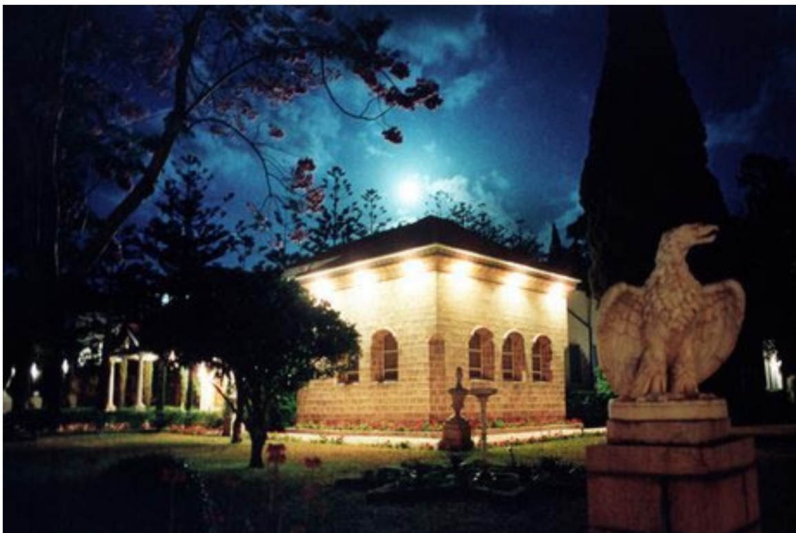
El Santuario de Bahá'u'lláh en la noche